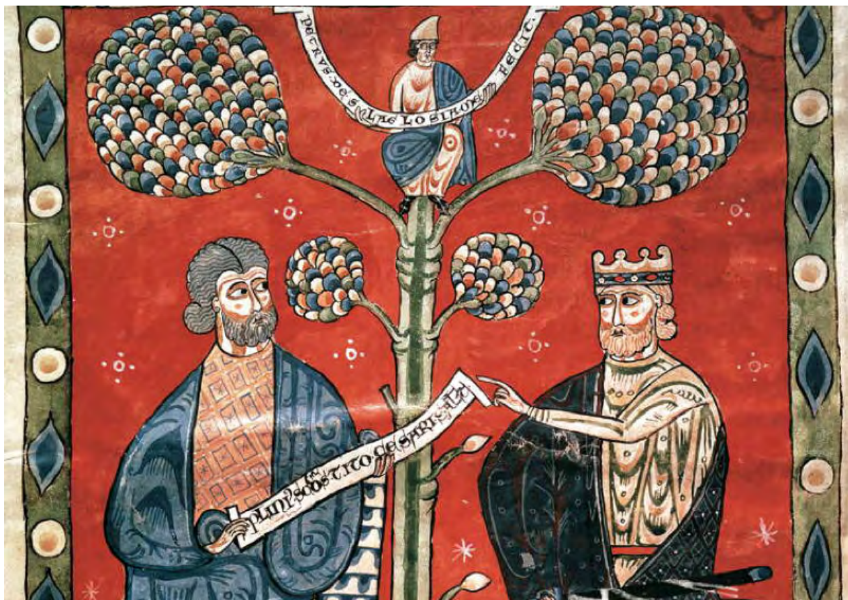
Plinio il vecchio e l'imperatore Tito in un'edizione del XII sec. dell'Historia Naturalis

La scelta dell'immagine non è casuale, ritrae Plinio il Vecchio che dedica all'imperatore Tito la sua enciclopedia la "Naturalis Historia". Enciclopedia indica una formazione "circolare", compiuta e definita come un cerchio. Nel mondo antico abbracciava un sapere unitario che coniugava insieme discipline umanistiche e scientifiche, perché la scienza era considerata figlia della filosofia e la tecnica era semplicemente un'ancella della scienza. La separazione delle discipline umanistiche da quelle scientifiche si profila quando il metodo sperimentale s'afferma nel campo scientifico, progredisce durante l'Illuminismo e dilaga nel periodo positivista con la piena e totale fiducia nell'applicazione del metodo scientifico a tutto lo scibile, anche alla letteratura, alla storia, all'arte, alla filosofia. La frattura definitiva è però recente, legata ai progressi tecnologici ed alla loro diffusione capillare. La tecnica da serva è diventata padrona trionfante. Fornisce protesi "necessarie" all'uomo, che quando ne è privo si sente debole e fragile, né trova più conforto nella cura di sé o dell'altro, cioè nella filantropia. Stando così le cose il sapere uma-