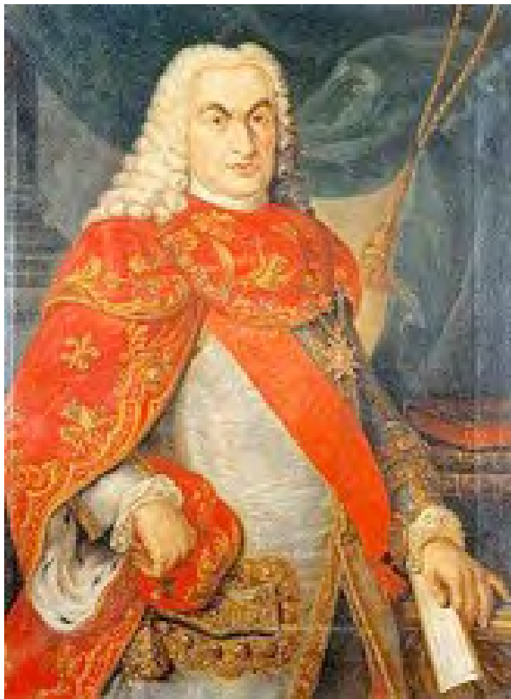
Il M.se Tanucci

Nel 1767 il Papa Clemente XIV emanò una bolla con la quale venne soppresso l'ordine della Compagnia di Gesù, in conseguenza della quale il marchese Bernardo Tanucci (1), emise subito il bando di espulsione dei Gesuiti dall'Isola. In conseguenza della espulsione dalla Sicilia dei Gesuiti, il m.se Tanucci mirava all'acquisizione, da parte dello Stato, dei beni della disciolta Compagnia, beni di rilevante quantità e qualità (erano le terre più coltivate e più redditizie della Sicilia), al fine di provvedere ai bisogni della popolazione.