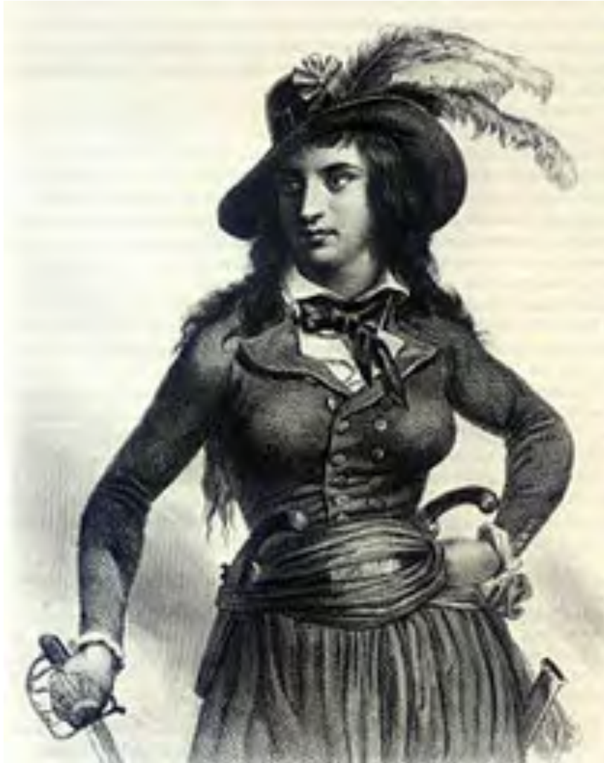
Théroigne de Méricourt

Théroigne de Méricourt, pseudonimo di Anne-Joseph Terwagne è stata una delle donne della Rivoluzione Francese rimaste in ombra, sebbene si sia molto battuta per la conquista dei diritti delle donne. Nata nel Lussemburgo belga in una famiglia di contadini agiati riceve una buona educazione prima presso una zia a Liegi, poi in convento. A sedici anni fugge dal convento e diventa dama di compagnia di Madame Colbert che ne completa l'istruzione insegnandole il canto, la musica, il piacere della lettura. Ma anche di questa vita non è soddisfatta e inseguendo l'amore si trasferisce a Londra e poi a Parigi agli inizi della Rivoluzione. Vi partecipa con entusiasmo frequentando le assemblee e organizzando un salotto a cui partecipano Mirabeau, Sièyès, Condorcet. Ha in mente anche la fondazione di