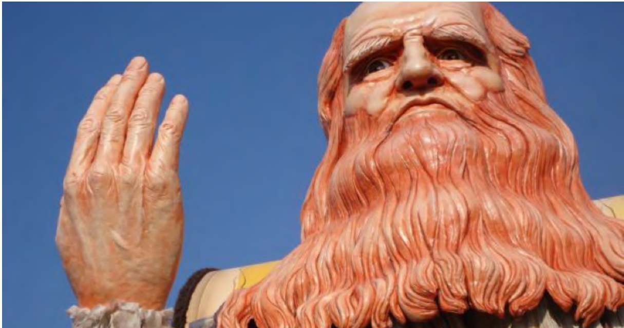
Leonardo da Vinci realizzato da macromega.it per il carnevale di Viareggio

Sono volati 500 anni e sembra ieri, o forse domani, se si riflette sulla complessità e completezza dell'uomo di Anchiano, borgo di Vinci, morto 500 anni fa.