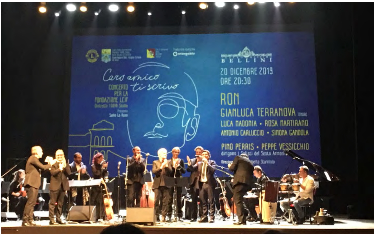
Serata di Gala dei Lions International al Teatro Vincenzo Bellini di Catania. Uno: Caro amico ti scrivo. Con Ron e Peppe Vessicchio