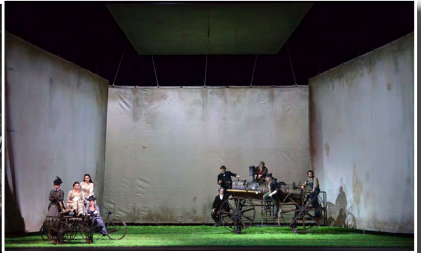
Foto di scena