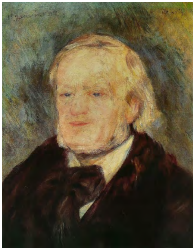
Pierre Auguste Renoir (1841-1919) Ritratto di Richard Wagner 1882 Olio su tela Cm 53 x 46 Grand Palais (Musée d'Orsay)