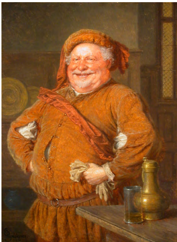
Dipinto di Eduard von Grützner