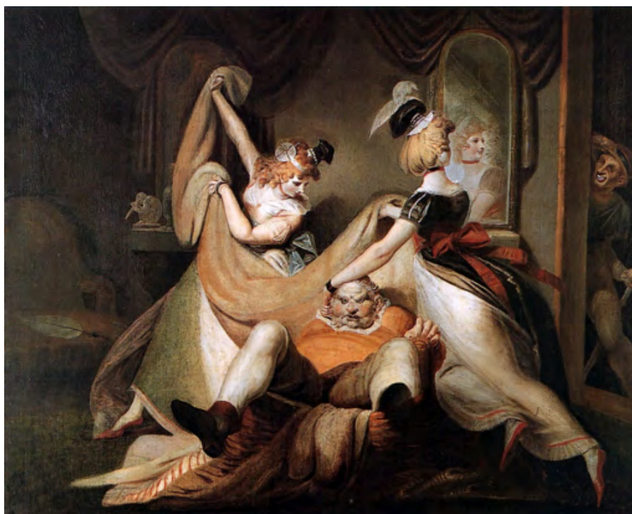
Nel cesto della biancheria

Nel Falstaff, da lui definita "commedia lirica in tre atti", ripartiti in due quadri per ciascuno, Boito seppe creare con un originale collage un personaggio nuovo per il teatro lirico, un po' barbiere e un po' don Giovanni, un don Chisciotte con il suo Sancho Panza, cavaliere grasso e vanitoso, ben miscelando il sir John Falstaff di Shakespeare, amante di cibo, bevande e donne, burlesco e