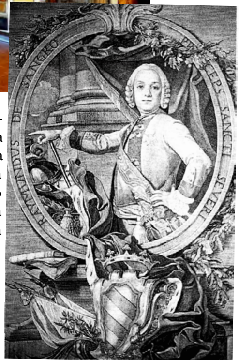
Raimondo di Sangro

Un'altra leggenda raccontava che la chiesa era stata eretta sopra un antico tempio dedicato alla dea Iside. Un'altra leggenda ancora, del 1623, narra che un uomo, ingiustamente arrestato, transitando lungo il muro del palazzo