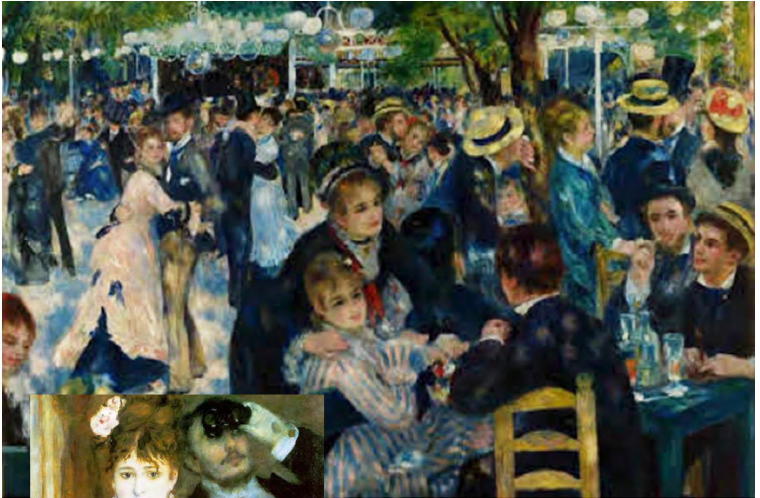
Renoir, Bal au moulin de la Galette , 1876, Musée d'Orsay, Paris

Raccontava il figlio Jean, noto regista cinematografico e autore della biografia Renoir mio padre (1962), che per lui il teatro era spettacolo da godere come una passeggiata in campagna e si disinteressava completamente dell'intreccio o dei caratteri. Emblematico perciò il suo rapporto con il teatro espresso in due dei più celebri dipinti.