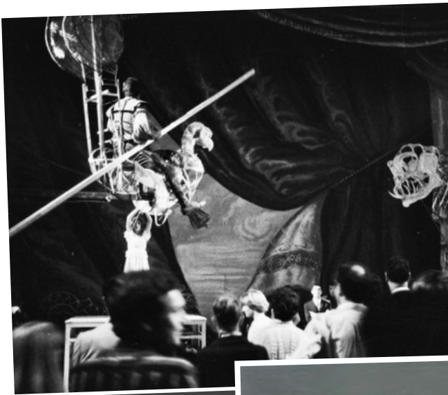
L'Ippogrifo a Spoleto