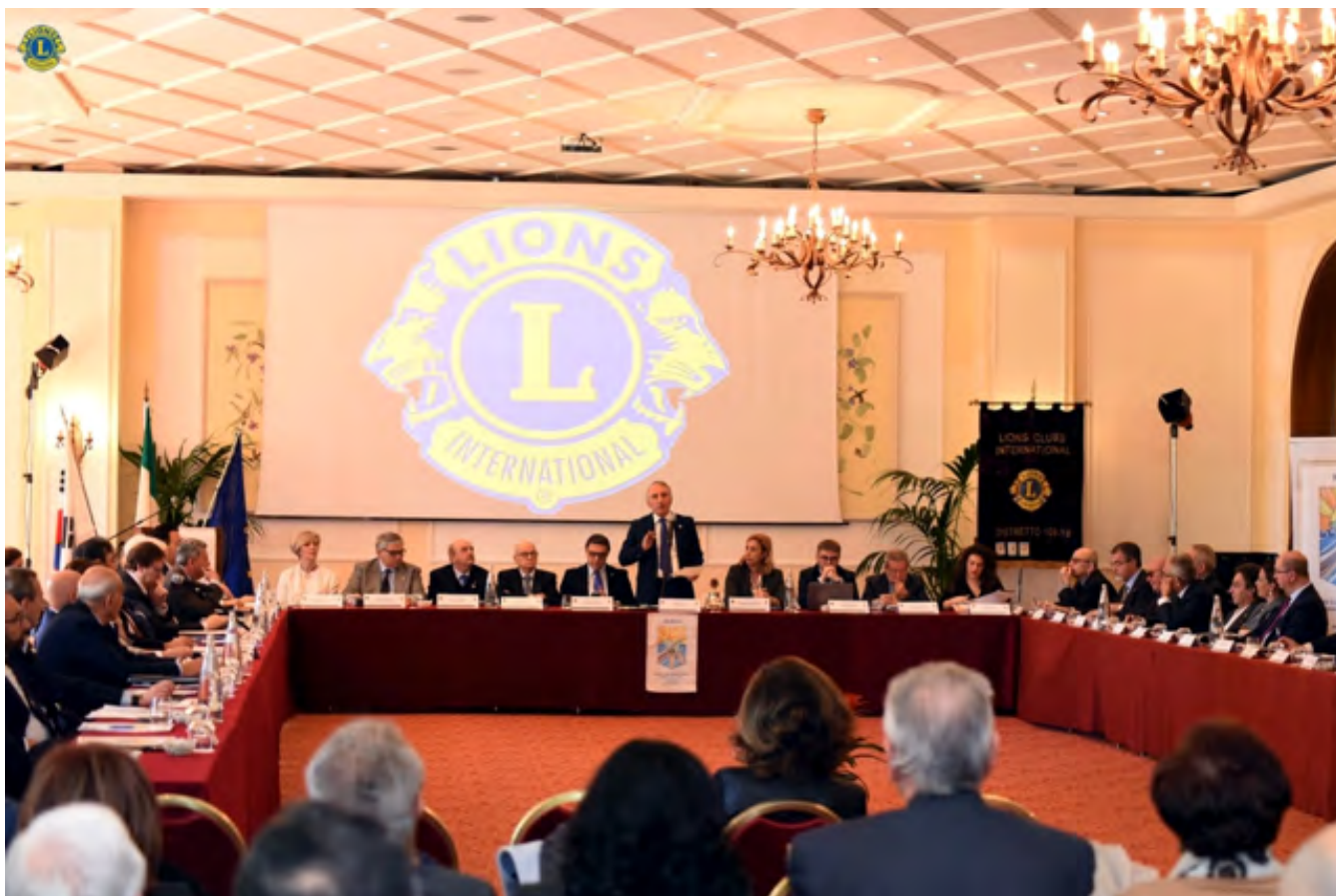
Gabinetto distrettuale . Al centro il Governatore

Nella sala congressi dell'Hotel Villa Diodoro a Taormina il 7 e l'8 febbraio si sono svolte la terza riunione del Gabinetto Distrettuale e la "Conferenza d'inverno" alla presenza del Governatore Angelo Collura e di numerose autorità lionistiche e civili. I lavori hanno avuto inizio con la Consulta dei Past Governatori alle 9.30 di giorno 7 e sono proseguiti con la riunione del terzo Gabinetto distrettuale. Aprendo la riunione del Gabinetto, il Governatore ha letto i messaggi di saluto e di augurio di Patti Hill, Terzo Vice Presidente Internazionale, di Gino Tarricone, Presidente del Consiglio dei Governatori, di Sandro Castellana, Past Direttore Internazionale, di Pino Grimaldi, Presidente Internazionale emerito, di Domenico Messina, Past Direttore Internazionale e rappresentante di LCI presso l'O.M.S.,