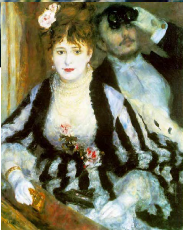
Il palco , 1874, Courtauld Gallery, London