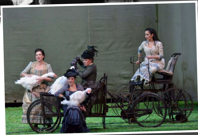
Petruzzelli di Bari

1926 e ne fece una memorabile registrazione con il baritono Giuseppe Valdengo. E fu l'ultima opera di Verdi prima della sua morte avvenuta il 27 gennaio 1901, nel deserto lasciato dai tanti amici che lo precedettero e nel 1897