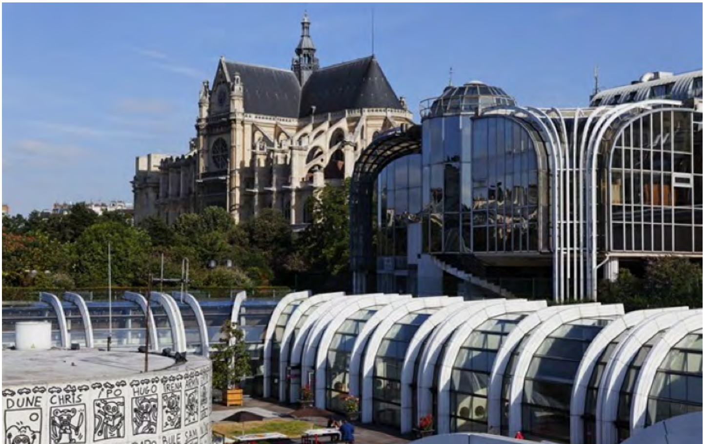
Saint-Eustache e Les Halles

Il piccolo Pierre-Auguste (Limoges 1841-1919) si era trovato da ragazzo, come tanti, a vivere il fascino delle nostre Chiese, specialmente lui alunno dei Fratelli delle scuole cristiane. Quasi tutti i bambini, fino alla mia infanzia, almeno, hanno avuto esperienza di quel profumo di incenso, di quei canti impressi nel cuore e l'organo struggente, quelle canne grigie che erompevano nelle navate e scioglievano il cuore. Per altri il rapporto è stato più coinvolgente e si è indossata la tunica bianca del chierichetto. Pierre-Auguste ebbe miglior sorte: diede la sua voce a Parigi al coro della chiesa di Saint-Eustache. È ancora oggi una delle più grandi e famose di Parigi, in gotico flamboyant in cinque navate e illuminata da stupende vetrate, che conferiscono una buona illuminazione all'ambiente. La chiesa fu fatta costruire da quel Francesco I che probabilmente acquistò da Raffaello la Gioconda che aveva portato con sé in Francia nel 1516. Essa conserva la Cena di Emmaus di