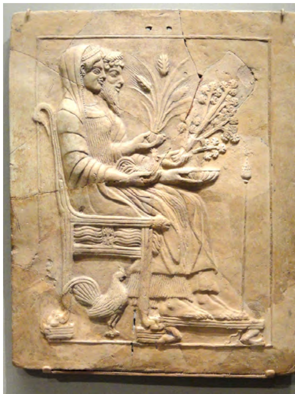
Ade e Persefone

Anche gli scrittori tragici, attenti a circondare ogni divinità di un nutrito elenco di epiteti e ad arricchire la loro personalità di più significati e funzioni, quando parlano di Persefone si limitano ad evocarne, con soggezione, solo il nome.